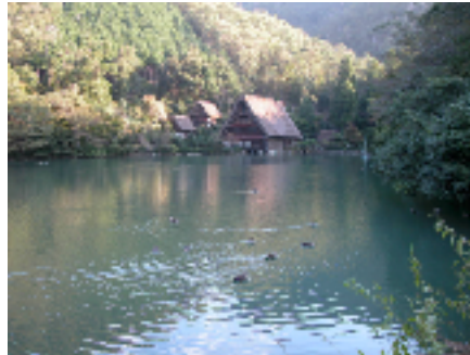
(集合場所の松尾池)

とき：毎週 土曜日の朝 7:00 松尾池集合 持ち物：お茶、タオル 服装：ズボン 底の厚い運動靴