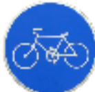
自転車専用道路標識

私の息子は、バスと接触して運転手にクレームをつけたことがありました。友人の娘さんは、大怪我をして後遺症が残ったのです。