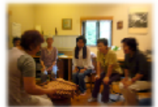
バリ島・竹の楽器で

からだの中を頭の芯まですうーっと突き抜けて心地よいハーモニー、この春訪れた知多の、やわらかな色の春の海が広がる・・・そして、もう何年前だろう、樹林を抜け出て目の前に現れた利尻山の頂。すぐそこに、礼文島へと続く海が、すこしづつ朝日を浴びて、きらきらと輝いていた・・・あの海、利尻富士に立った朝。