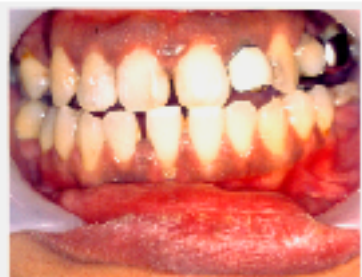
図1: 歯肉だけでなく、唇も黒く変色しています。