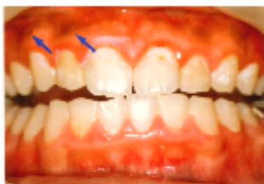
図1 黒く変色している歯肉(引用文献左記)

[参考写真] 帝京大学薬学部ホームページより http://www2.odn.ne.jp/~had26900/index.htm