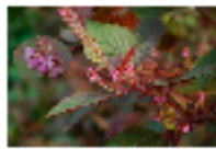
【シソ】本種の葉、枝先を生薬ソコウ(蘇葉)と称し、解熱、鎮咳、健胃、利尿などの目的で香蘇散、半夏厚朴湯などの漢方処方に配合される他、葉は食用としても利用される。

各生薬の特徴により、季節、病気の過程と症状および体質に合わせて、漢方の方剤あるいは単味薬の組合せを