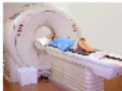
高速らせんCT (ALCA, HPより)

1975年、治る肺がんを見つけようと、国立がんセンターの医師たちが中心になって、東京・市ヶ谷にある「東京都予防医学協会」で、始めた肺がん検診の会です。初めは、胸部X線写真と喀痰細胞診を年に二回受けていただいていたのですが、1993年から、これらにCTを加えた方法に発展させました。年会費5万円+消費税払えば、誰でも会員になれます。