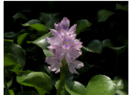
[ホテイアオイ(布袋葵)]

<記事紹介> 今日、公共施設での禁煙運動が高まってきています。ここに学校での受動喫煙対策を調査した記事をご紹介します。